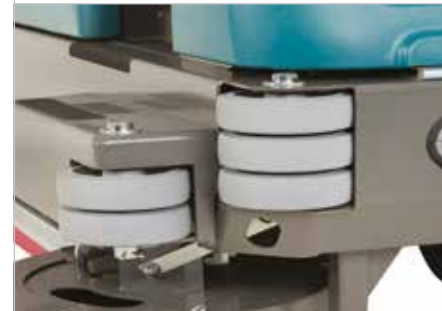
Massiver Stahlrahmen mit weichen Eckrollen

Fahrschutzdach zum Schutz des Bedieners vor herabfallenden Objekten.